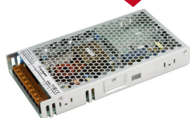
ARS-35-12-FA ARS-35-24-FA ARS-50-12-FA ARS-50-24-FA ARS-75-12-FA ARS-75-24-FA